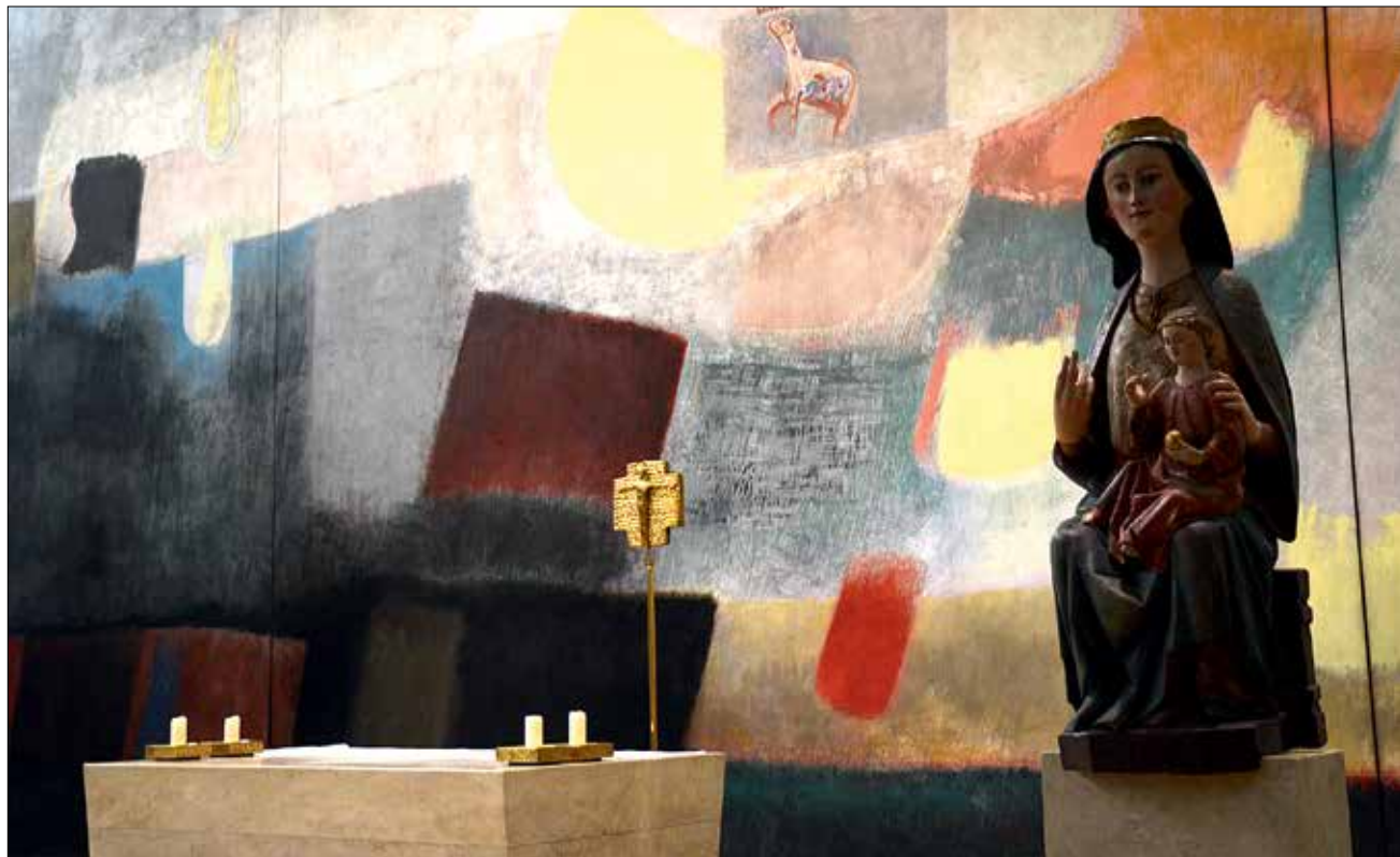
Die Gedenkkirche Regina Martyrum in Berlin-Plötzensee: sie ist Veranstaltungsort der „Ideenwerkstatt Kirchenbilder 2020“ (siehe Infokasten).

Beginnen würde ich das Pastoral-konzept jedoch mit einem Gedanken, der eine motivierende Kraft besitzt. Viele sprechen von Visionen. Wovon träume ich? Wie stelle ich mir die Zukunft im Pastoralen Raum vor? Wie kann ich mithelfen, dass Gott in dieser Welt erfahren wird?