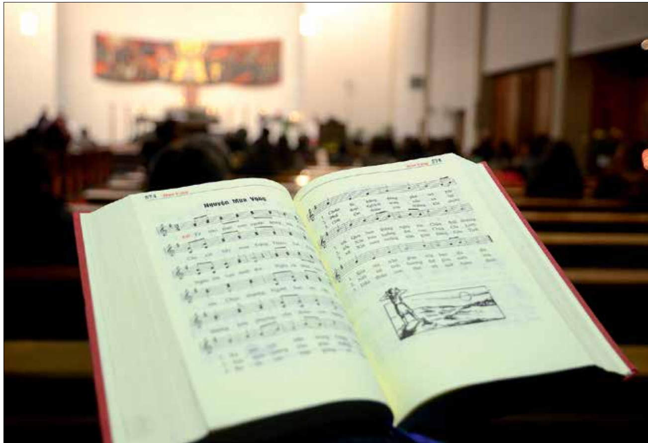
„Thánh Ca“ heißt das Gesangbuch der vietnamesischen Katholiken in Deutschland. Es findet auch in der Muttersprachlichen Gemeinde in Berlin Verwendung.

Westen, wie zahlreiche Vietnamesen in Berlin. Andere der heutigen Gemeindemitglieder begannen in den 80er Jahren in der DDR als Arbeitsmigranten.